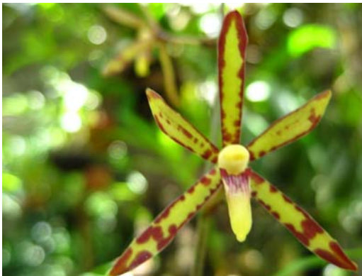
Ảnh: Hà Khắc Hiểu

Đồng danh : Armodorium labrosum (Lindl. ex Paxton) Schltr. 1911; Renanthera leptantha Fukuy. ex A.T.Hsieh, 1955