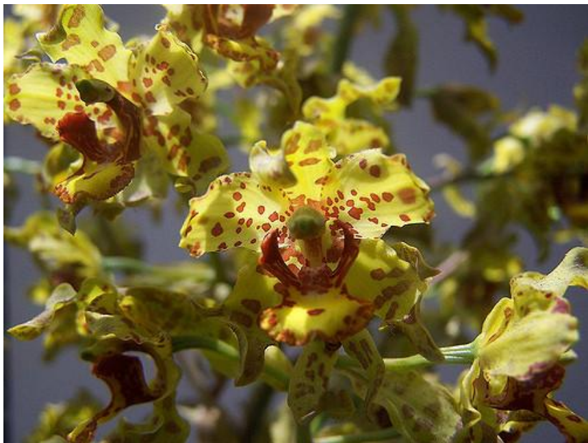
Cyrtopodium buchtienii