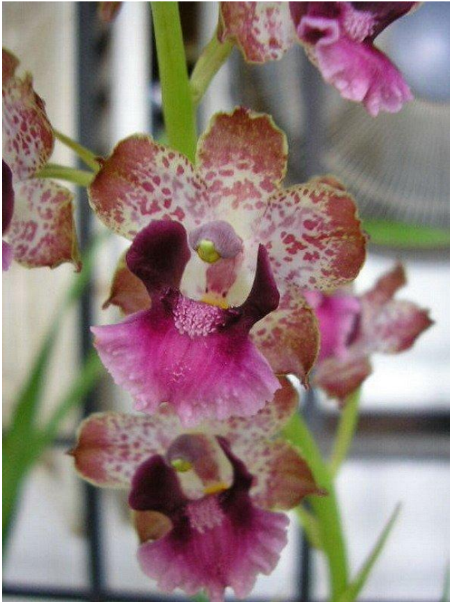
Cyrtopodium brandonianum Orchids Species