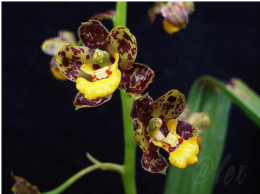
Cyrtopodium dusenii Flickr