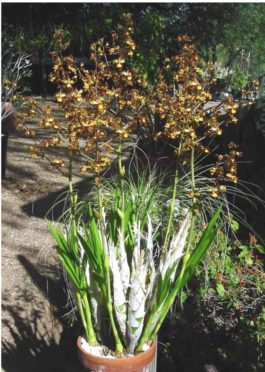
Arizona-Sonora Desert Museum