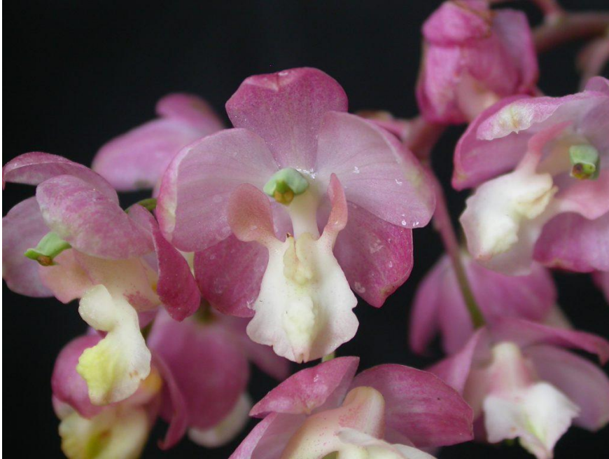
Cyrtopodium hatschbachii Orchid Species