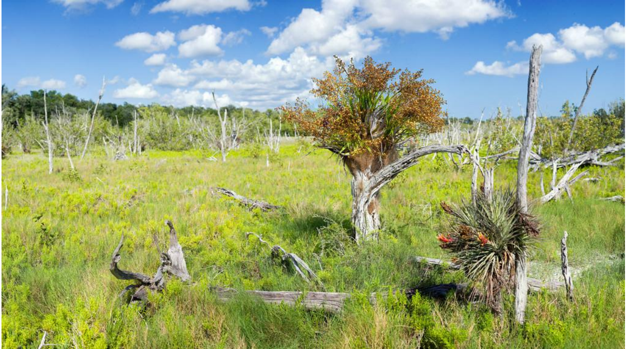
Cyrtopodium punctatum , Florida

Hai cây lan này mọc đều có mọc tại các khu đầm lầy ở miền Nam Florida, Hoa Kỳ, cây Cyrt. punctatum mọc ở trên cành cây hoặc gốc cây, còn cây Cyrt. andersonii mọc ở dưới đất.