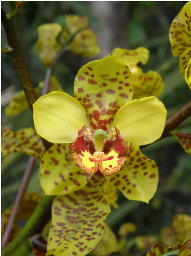
Cyrtopodium gigas Orchid Species