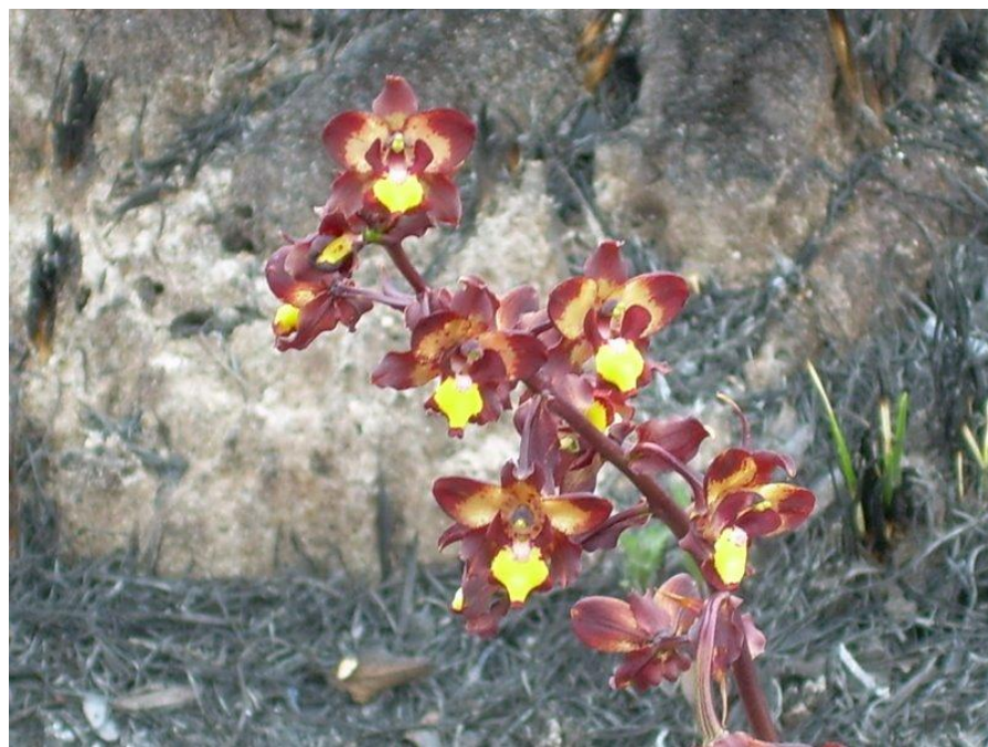
Cyrtopodium gonzalezii Orchids Species