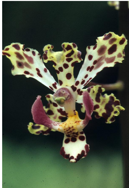
Cyrtopodium blanchetii Swiss Orchid Foundation