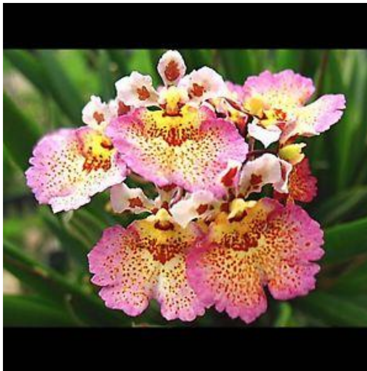
Tolumnia Jarax Flyer ebay.com