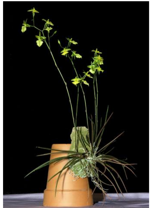
National Judging Center