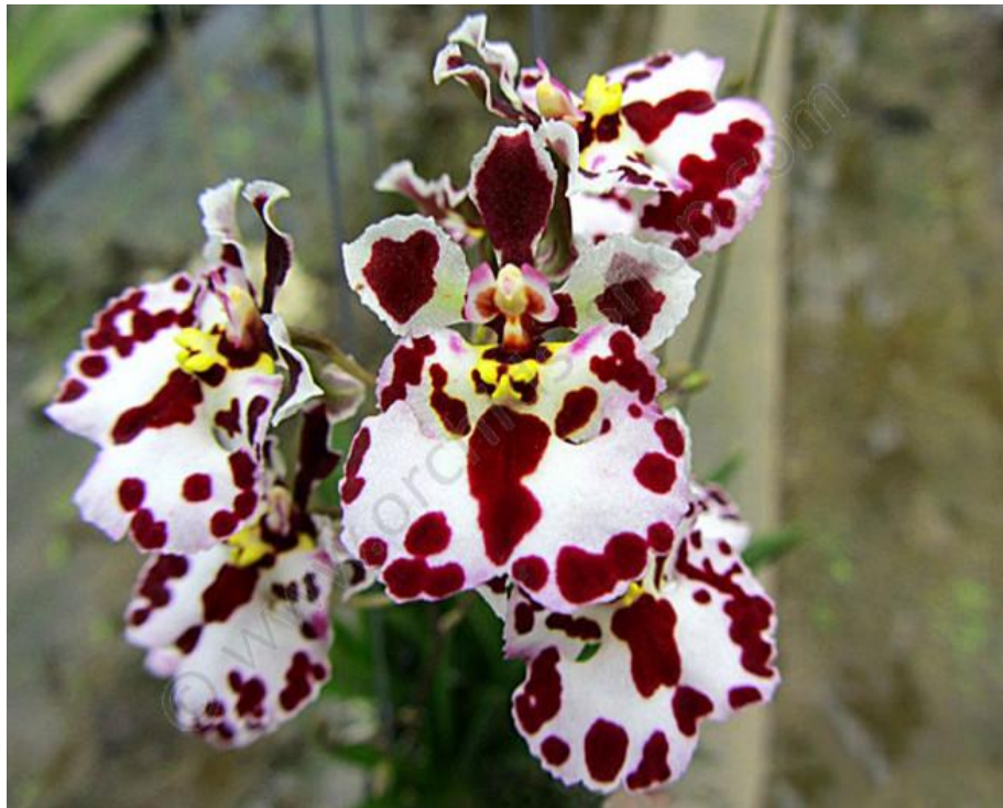
Tolumnia Jairak Firm Claessen Orchids