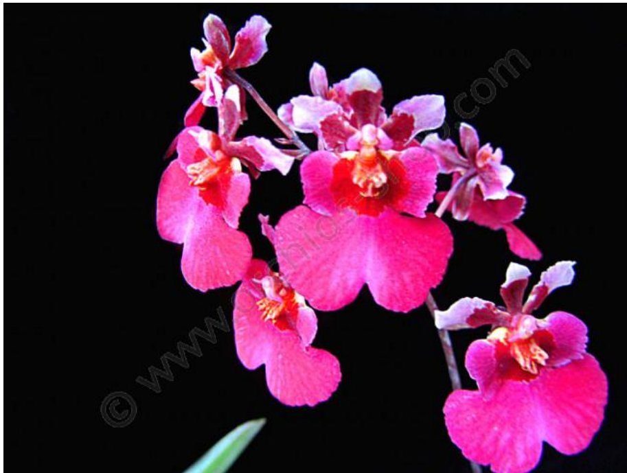
Tolumnia Jairak Rainbow Claessen Orchids