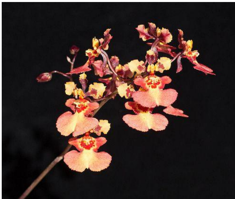
Tolumnia Genting sunshine Pinterest

Những cây đã được lai giống rất nhiều và rất đẹp.