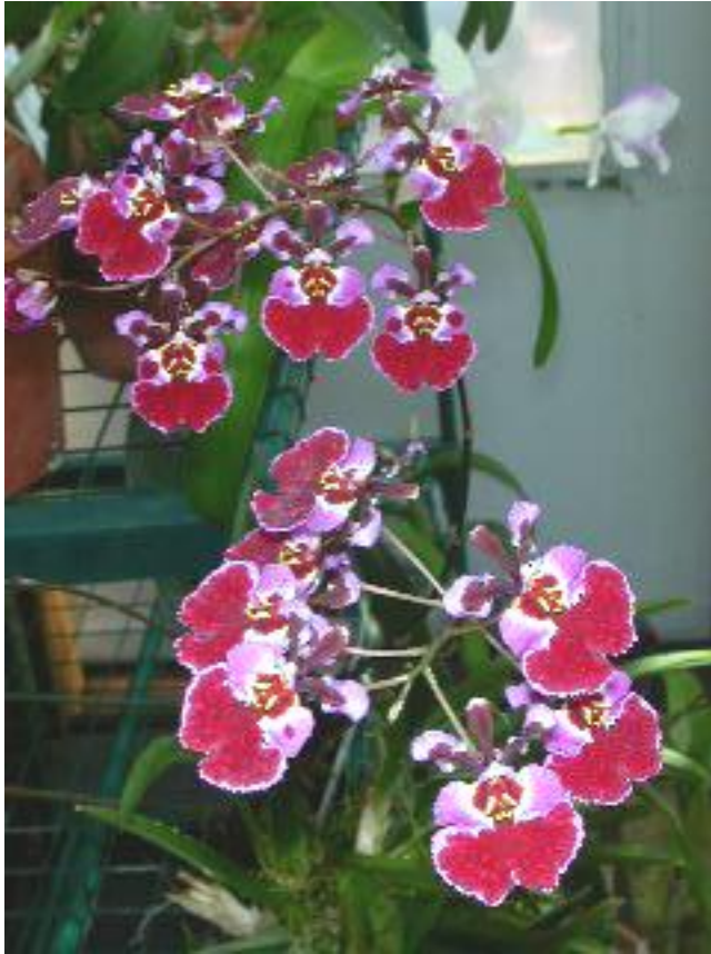
Tolumnia Pink Deluxe rv-orchidworks.com

Đặc biệt là những cây lan này giá chỉ từ $10-20 tùy theo nơi bán, tuy nhiên cây lan mới lai giống sau đây được ebay bán ra với giá $65.