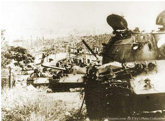
Column of North Vietnamese Communist T54 tanks destroyed in Battle of An Loc